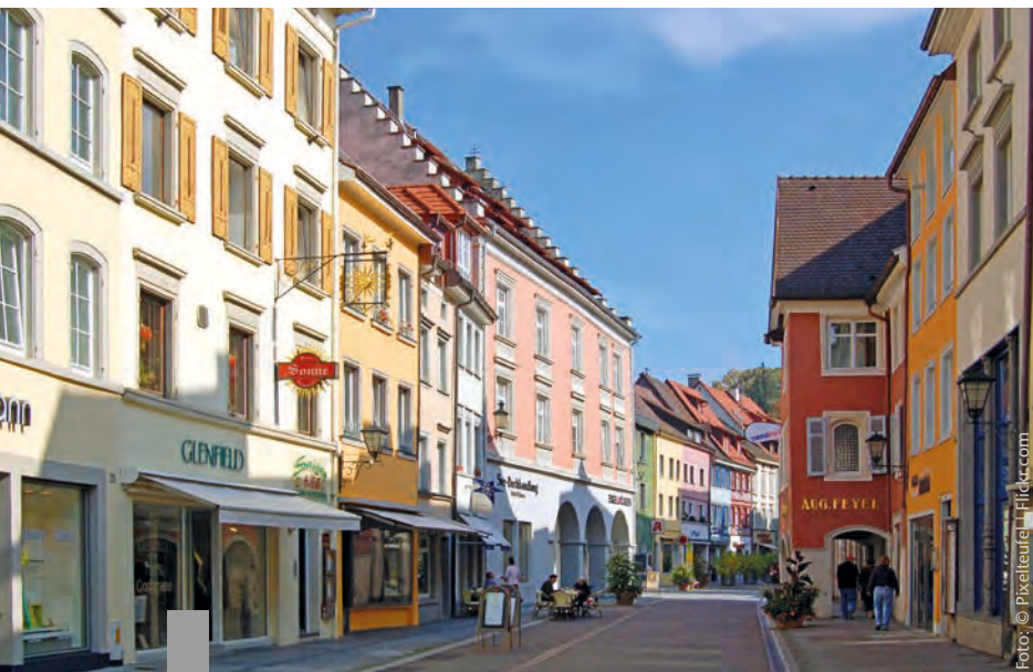
Bezahlbarkeit, Fußläufigkeit und Durchmischung sind für Stadtplaner die wichtigsten Kriterien einer zukunftsfähigen Stadt.

In den Großstädten beträgt für über 90 Prozent der Bewohner die durchschnittliche Distanz zu den Angeboten deutlich unter 1.000 Meter: Supermarkt 490 Meter, Hausarzt 440 Meter, Apotheke 530 Meter, Grundschule 590 Meter, ÖV-Haltestelle 360 Meter. In kleineren Städten und Landgemeinden ist die fußläufige Erreichbarkeit aller Angebote hingegen die Ausnahme. Immobilienkäufer legen nach einer Umfrage von Immobilienscout24 zunehmend Wert auf eine alltagstaugliche Umgebung. Gute Einkaufsmöglichkeiten stehen für 72,2 Prozent aller Kaufinteressenten ganz oben auf der Wunschliste. Im 5-Jahres-Vergleich ist diese Vorgabe immer wichtiger geworden. 59,8 Prozent der Befragten wünschen sich in der direkten Umgebung der Immobilie eine gute Verkehrsanbindung mit öffentlichen Verkehrsmitteln, über Natur, Wälder und Wiesen freuen sich 46,1 Prozent, ärztliche Versorgung erwarten 45,9 Prozent, und die Nähe zum Arbeitsplatz wäre für 28,7 Prozent von Vorteil.